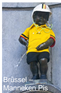
Brüssel – Manneken Pis