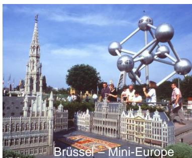
Brüssel – Mini-Europe